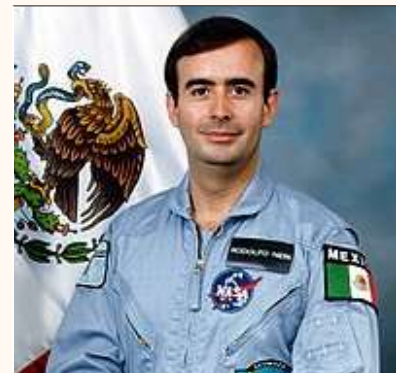
1952 - Rodolfo Neri Vela

(F. 1985), fue un pintor, litógrafo y escenógrafo. Fue un precursor y protagonista del arte contemporáneo de México y difusor del arte y la cultura mexicana en el extranjero.